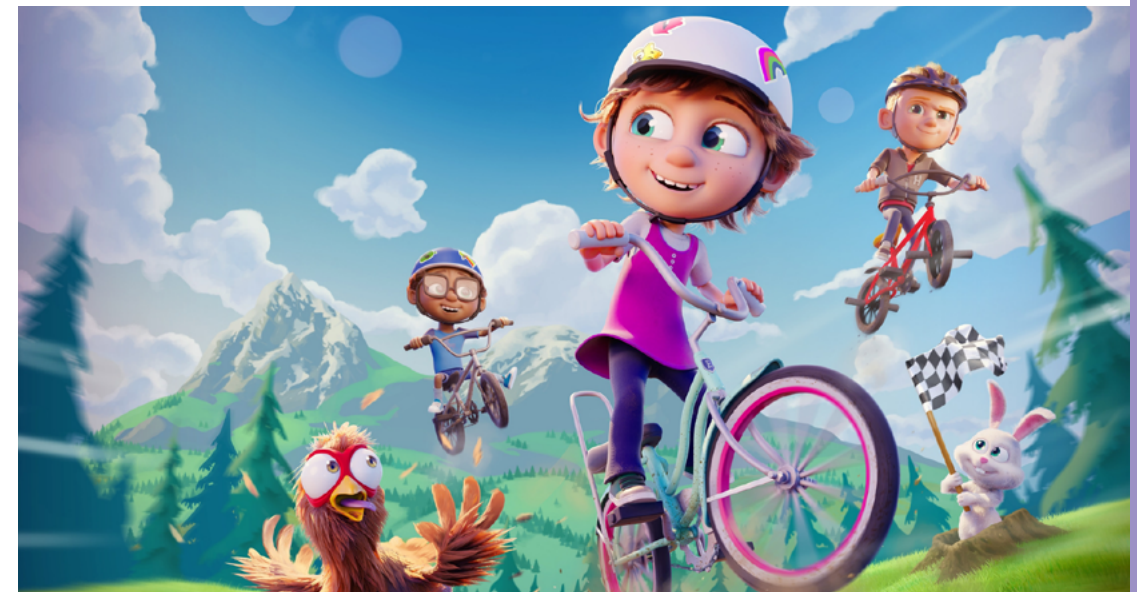
Ella Bella Bingo