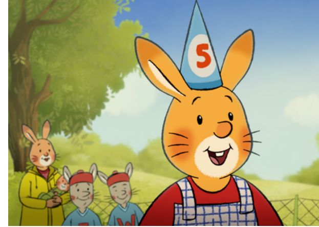
Najlepsze urodziny Królika Karola