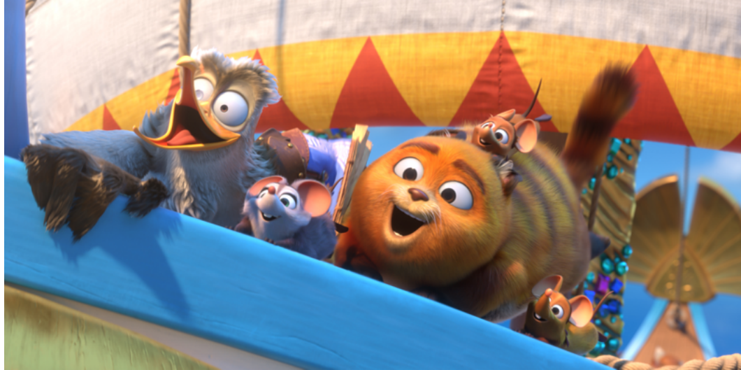
Pati i kłątwa Posejdona