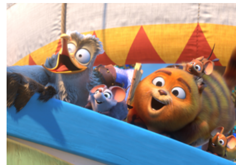
Pati i klątwa Posejdona