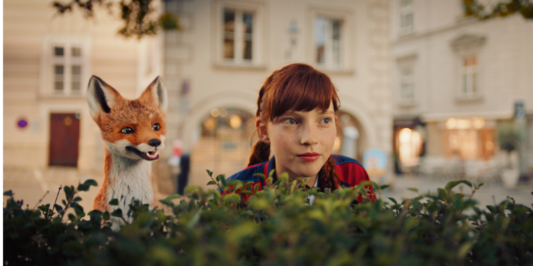
Szkoła magicznych zwierząt