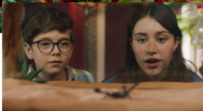
Pamiętniki Tatusia Muminka